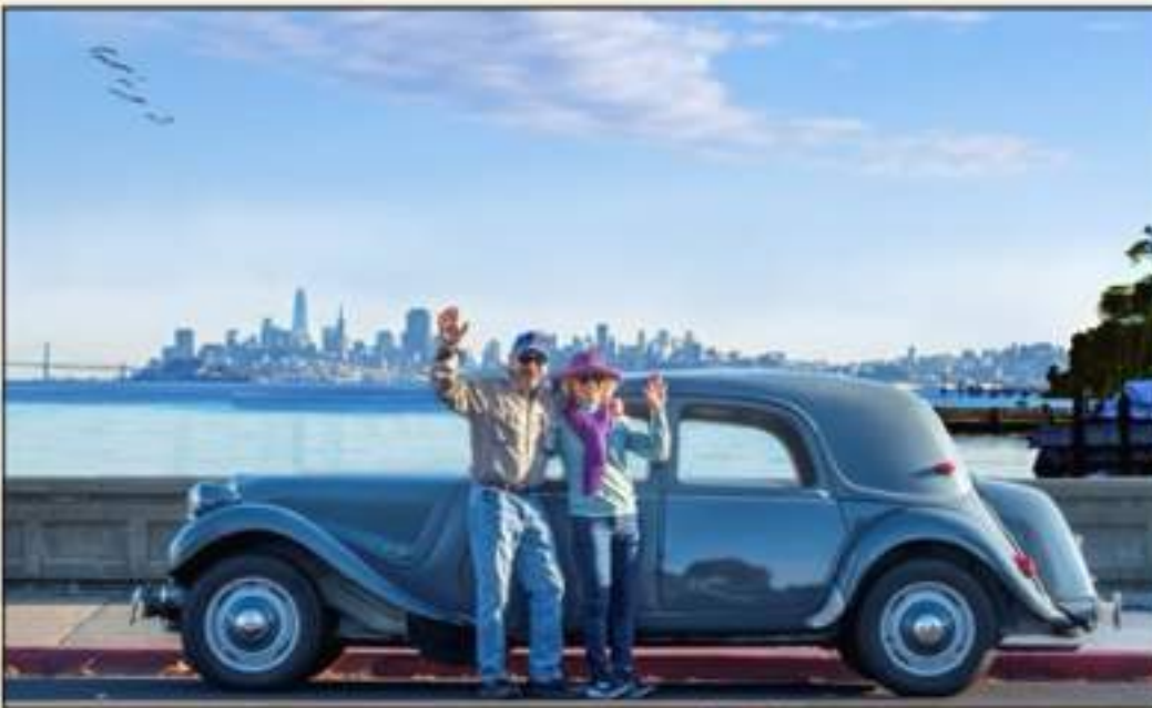
Le Temps Passe Vite! Meilleurs Vœux Pour La Nouvelle Année!