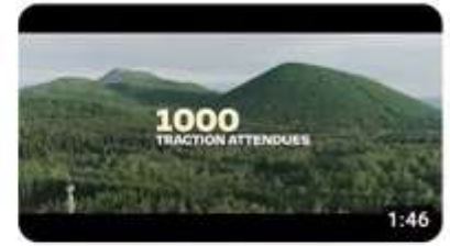
Film promotionnel pour les 90 ans de la Traction avant