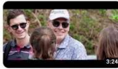
Let's go pour les 90 ans de la Traction avant

Vous retrouverez ces vidéos sur notre chaîne Youtube, ainsi que les vidéos de témoignages de nos correspondants étrangers.